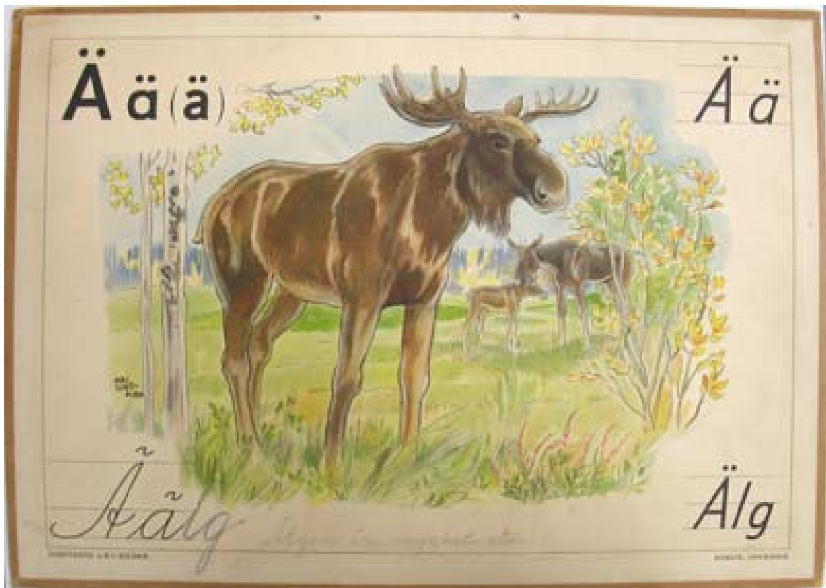
En skolplansch från 1949

Nuförtiden har klasskamraterna ytterst lite kontakt med varandra. De som bor kvar i Vänersborgsområdet stöter dock på varandra ibland och har lite kontakt.